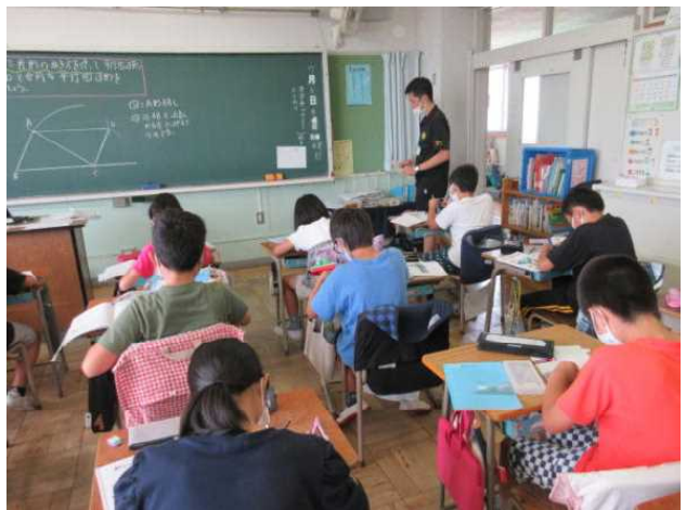
5年の俳句と、算数の図形、合同な四角形を描いています。