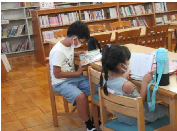
涼しい部屋で、静かに読書にいそんでいます。『読む子は育つ！』