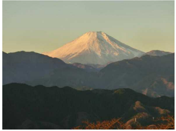
朝日を浴びて、まだいくらか赤く見える富士山です。