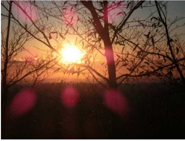
すっかり、日が昇ってしまいました。