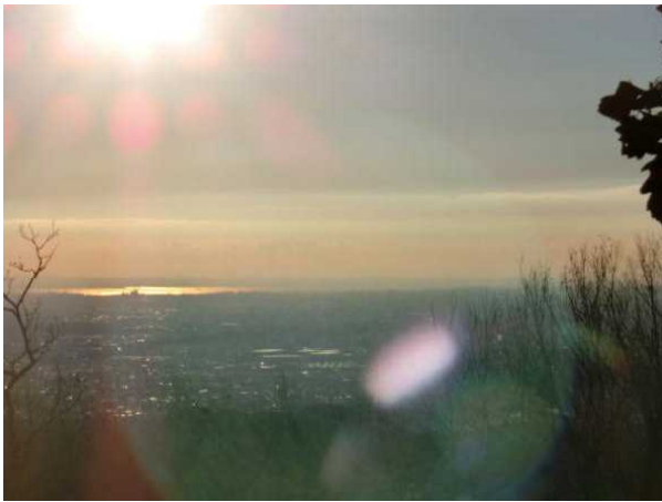
キラキラと相模湾が見えます。