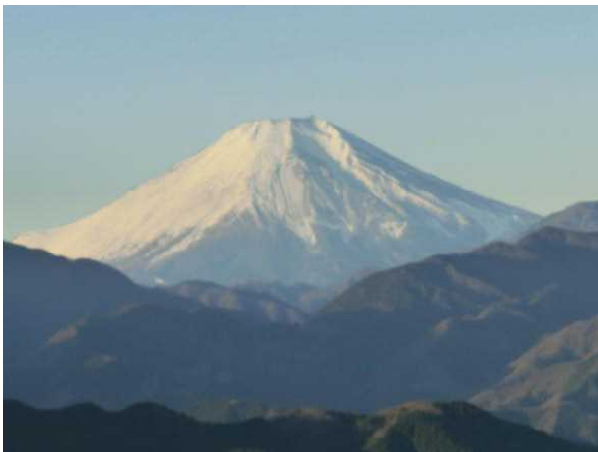
どんどん白くなっていく富士山です。