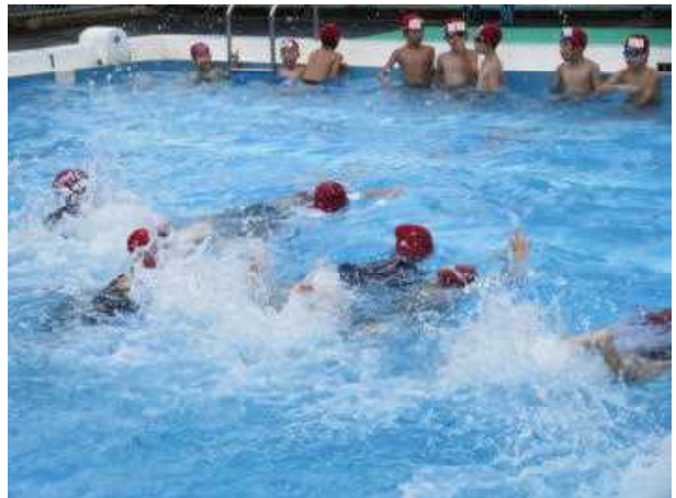
雨が上がり4年が水泳をはじめました。水温30℃、気温25℃ですが、風も止み気温も上がってきそうです。