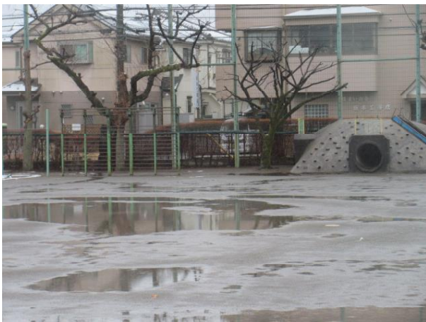
今朝の校庭の様子です