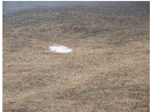
わずかな雪が芝生の上に

子ども達の登校時の心配も減りました。かさをさして、車に気を付けることですみそうです。