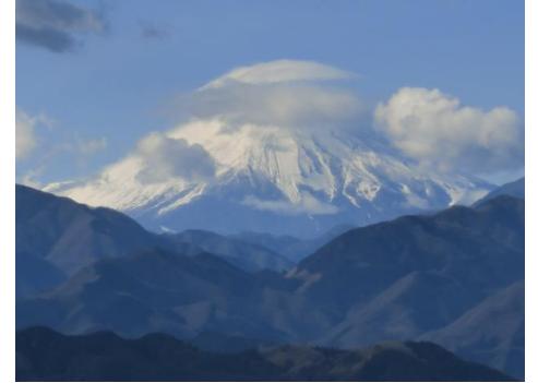
1月4日、高尾山の山頂より