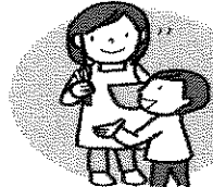
家族の人に話しておく