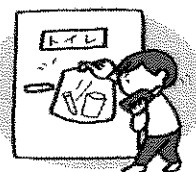
容器をトイレのドアに貼っておく