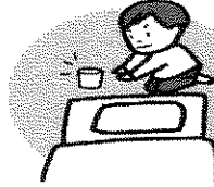
容器を机の上に置いて寝る