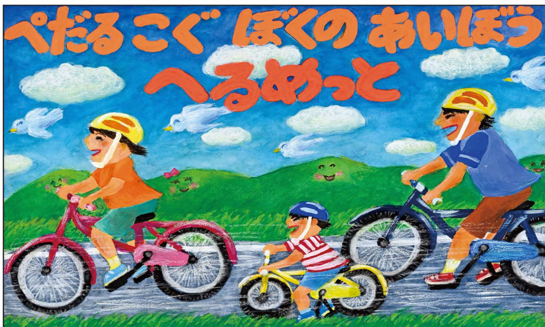
R5. 内閣府特命担当大臣賞