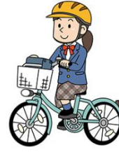
自転車に乗る人物はヘルメット着用