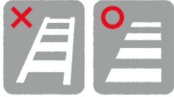
横断歩道ははしご形ではありません