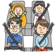
自動車に乗る人物は全員シートベルト着用