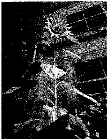
大きく育ったひまわり