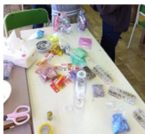
スノードーム材料 ス