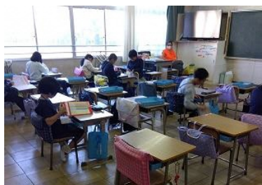
わいわい寺子屋(宿題室)