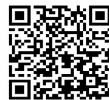
案内チラシQRコード