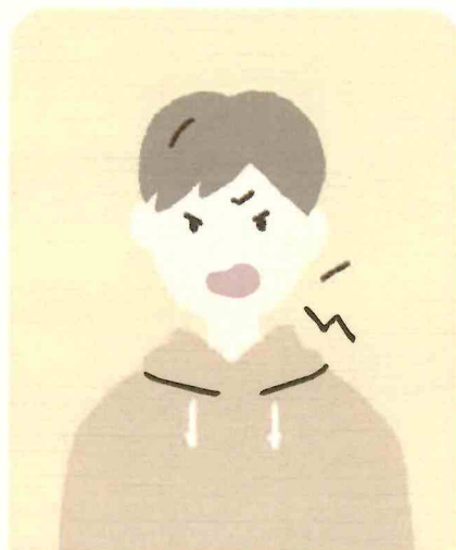
怒りやすくなった