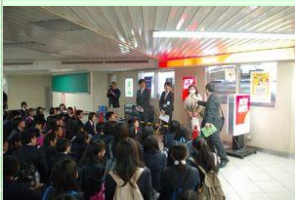
東京駅に集合です。