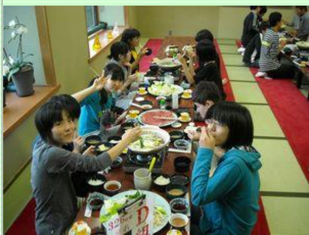
おいしい夕食でした。