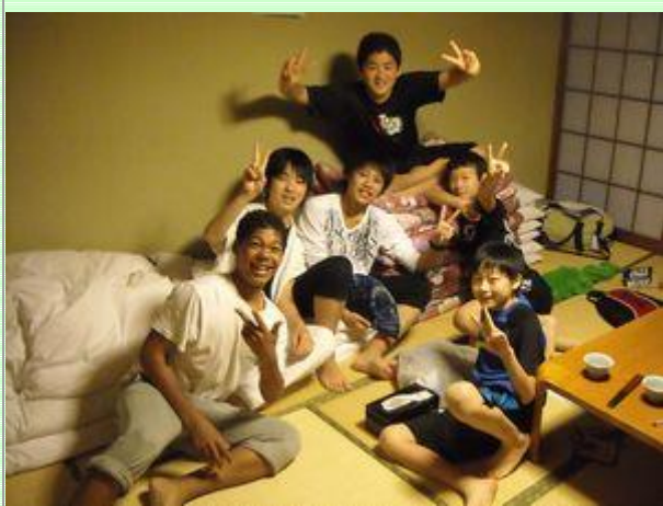
はしゃいでいるのは誰ですか。