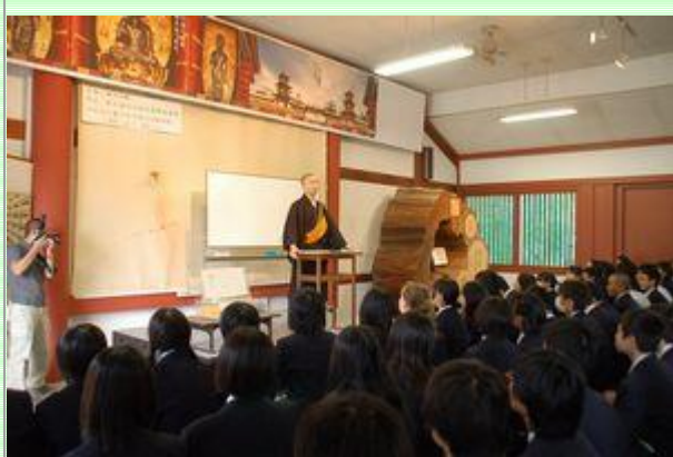
薬師寺、お坊さんの有難い話。