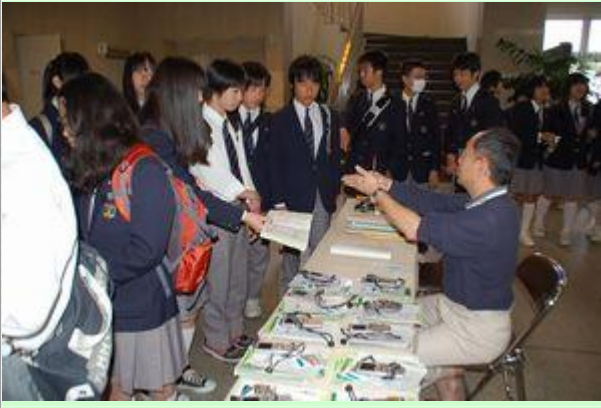
宿舎でチェックを受けて班行動開始。