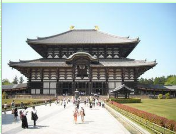
東大寺大仏殿です。