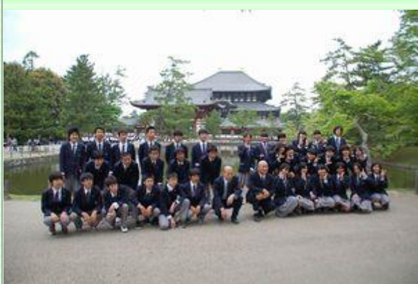
東大寺前にて集合写真。