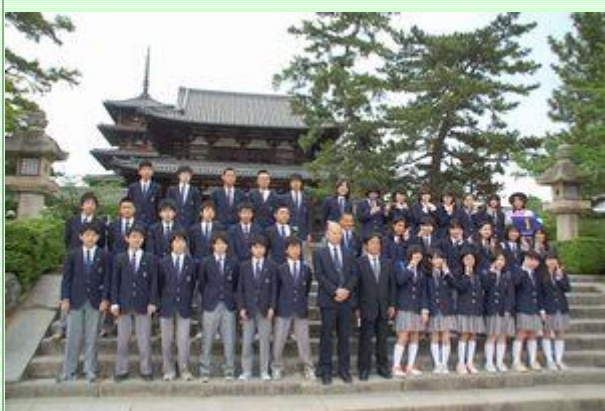
法隆寺にて集合写真。