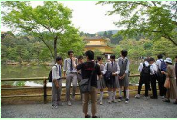
金閣寺で先生が班写真撮影。