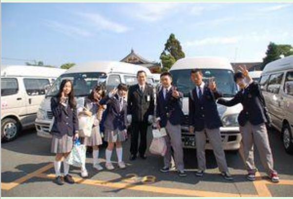
タクシーで班行動開始。