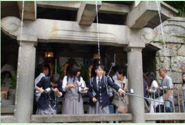
清水・音羽の滝です。