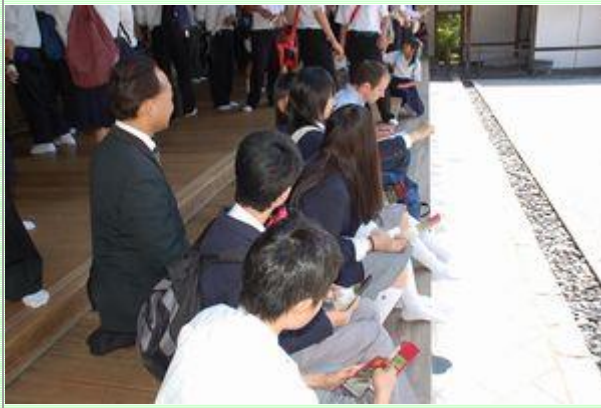
竜安寺にて班写真です。