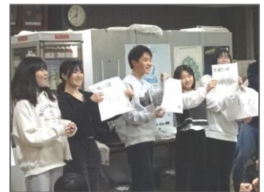
スキー移動教室 レク（1年）

さて、1月16日（木）～18日（土）、1年生は長野県菅平高原でスキー移動教室を実施しました。三中が訪れた時は毎日雪が降っていたため、とても良いグレンデコンディションの中で、講習を行うことができました。3日間の講習で、初めてスキーに挑戦したグループも含め、全員がリフトに乗って山頂付近まで上がり、滑って降りてくることのできるようになりました。最終日には、「まだ滑りたい」、「帰りたくない」という声がたくさん聞かれました。また、食事や宿舎での生活でも、一度注意を受けたことについて、みんなで声を掛け合いながら、修正、改善する姿が見られ、3日間で、個人としても、また集団としても、大きく成長したと感じられました。1日目、2日目に行ったレクでは、係の人たちが工夫を凝らして準備したレクを、みんなが全力で楽しみ、大いに盛り上がっていました。クラスや学年の団結力もまた増したのではないのでしょうか。