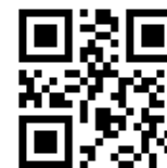
配信停止用QRコード

立川市 ( tc-aa@city.tachikawa.lg.jp ) から届くメールに記載されているURLにアクセスします。 登録を削除する を押し、削除完了メールが届きましたら完了です。