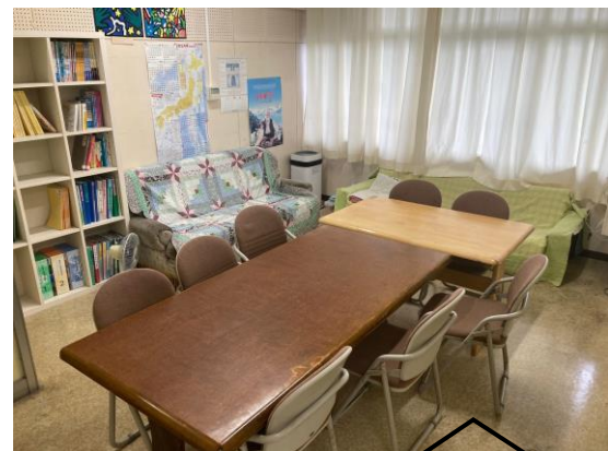
職員室のリニューアル写真

六中卒業生の保護者をご存知だと思いますが、通称「蜂の巣」と呼ばれる部屋です。生徒も先生たちもより快適に過ごせるように、夏休みに整理しました。ここでひと休みしたり、いろいろな話をしたいできます。