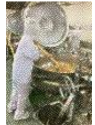
～各事業所での生徒たちの様子(この他にも多くの事業所で体験しました)～