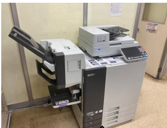
職員室の新しい印刷機

自由にカラー印刷できるようになりました。 配布される授業プリントや学年だよりがより見やすくなると思います！