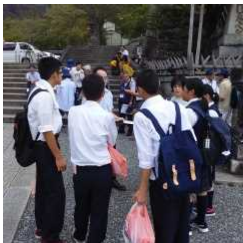
清水寺チェックの様子