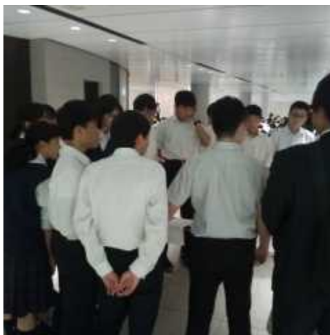
出発前の班長との打合せの様子