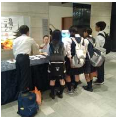
宿舎への帰着チェックの様子