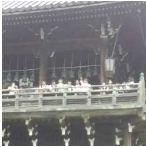
二月堂からは奈良公園の景色を一望することができました